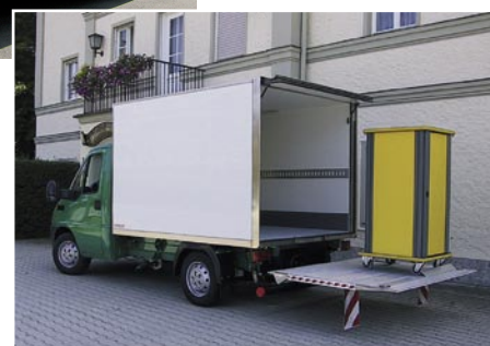
Ducato mit Ladebordwand

Fiat Ducato Fahrgestell mit Fahrerhaus 35 Rst. 3450 mm, 3,5 to Gesamtgewicht Nutzlast ca. 1000 kg