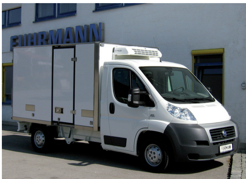
Rst. 3450 mm, Gesamtmaße außen: Länge 5500 mm, Breite 2100 mm, Höhe 2600 mm