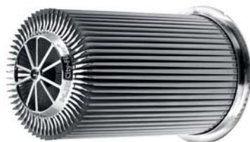
Sauber durch die Stadt – mit dem HJS City-Filter

Bereits im vergangenen Jahr erhielten Diesel-Fahrzeughalter